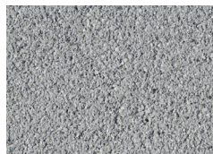
graniton szary jasny