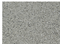
graniton szary organic